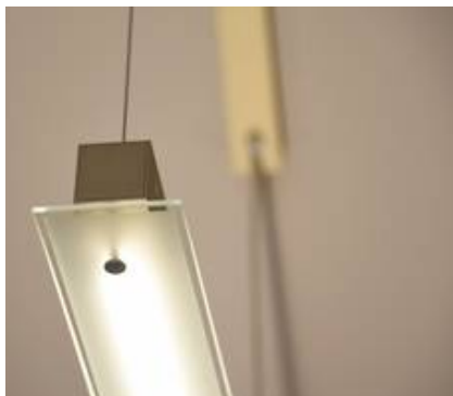
in einem Goldton, Glas mattiert mit klarem Rand am Streifen