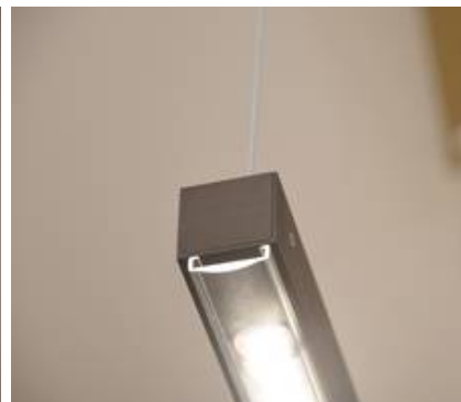
Aluminium in einem Baubronce-ton, ohne Glas